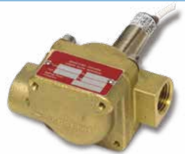
Die EF-G serie

Die Prozess-Abschlüsse für das SP-G und EF-G sind entweder Innengewinde DN 15 (1/2 ") oder Aussengewinde DN 20 (3/4 "). Die Geräte werden aus Kupfer-Legierung hergestellt mit Innenteilen aus Edelstahl. Das EF-G hat zusätzlich ein Teil aus Kunststoff-Laminat welches den induktiven Sensor schützt.