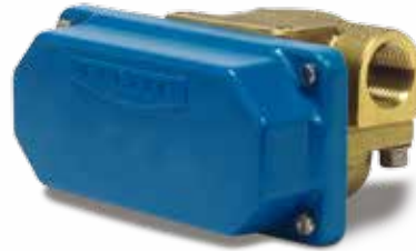
Die SP-G serie