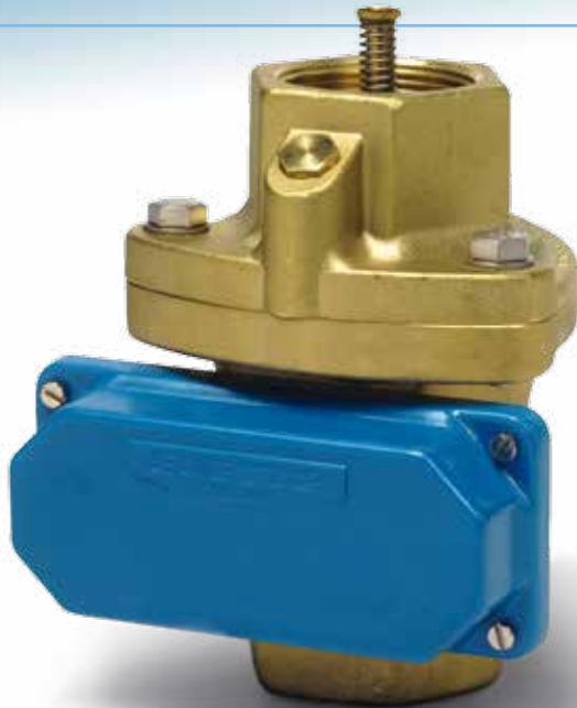
Die SP-GA serie